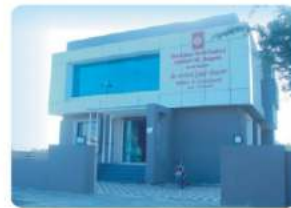
Branch - BEDAKIHAL