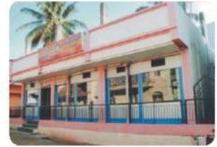
Branch - CHIKODI