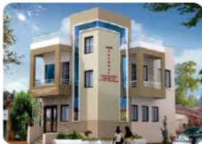
Branch - MANGUR