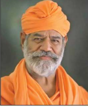
ಸ್ವಾಮಿ ಶ್ರೀ ಚಾರುಕಿರ್ತಿ ಭಟ್ಟಾರಕ ಪಟ್ಟಾಚಾರ್ಯ ಮಹಾಸ್ವಾಮಿಜಿ ಶ್ರವಣಬೆಳಗೊಳ