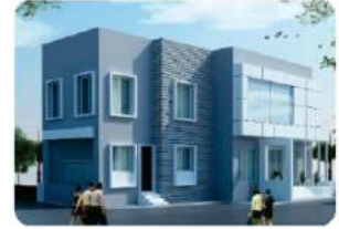
Branch - BHOJ