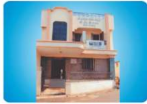
Branch - MANAKAPUR