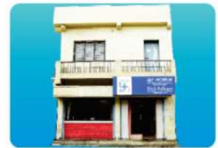
Branch - UGAR-KHURD