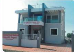
Branch - HARUGERI