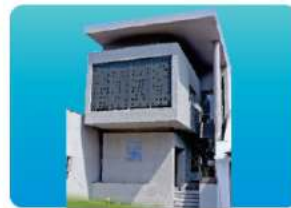
Branch - KOGANOLI