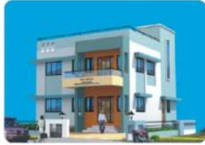
Branch - GALATGA