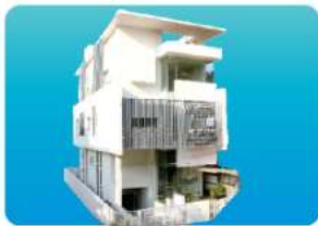
Branch - NIPANI