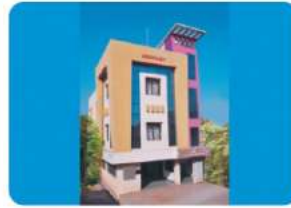
Branch - SADALGA