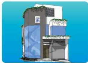
Branch - PATTANKUDI