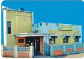
Branch - DHONEWADI