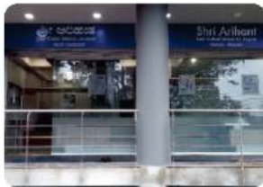
Branch - DHARWAD