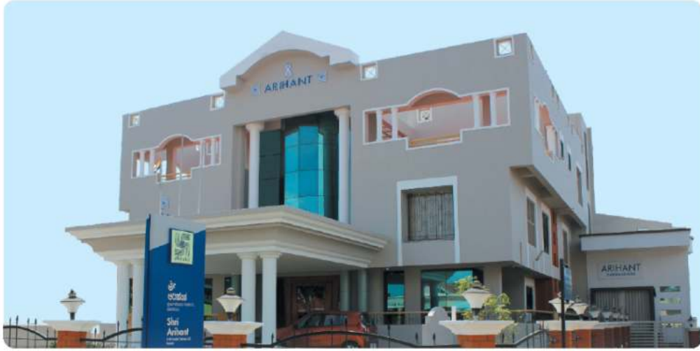
HEAD OFFICE - BORGAON