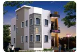
Branch - KARADAGA